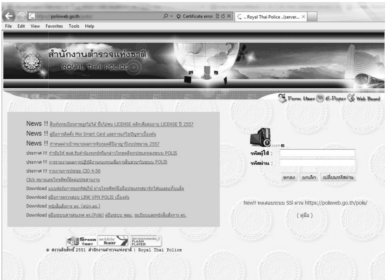
รูปที่ ๑ ตัวอย่างหน้าต่างเว็บไซต์ POLIS โดยมี URL http://172.17.2.66/polis หรือ https://polisweb.go.th/polis เข้าผ่านเว็บเบราว์เซอร์ Internet Explorer